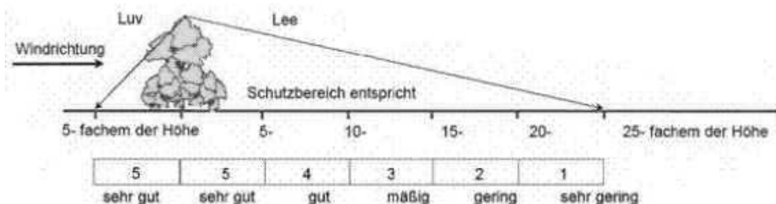
Abbildung 2: Stufen der Schutzwirkung und Einteilung von Schutzbereichen vor und hinter Windhindernissen (nach DIN 19706)

Gemäß DIN 19706 erfolgt die Klassifizierung der Schutzwirkung von Windhindernissen nach Abbildung 2 in Abhängigkeit von der Höhe des Windhindernisses und bei senkrechter Ausrichtung zur vorherrschenden Windrichtung.